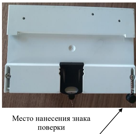
Рисунок 2 - Общий вид счётчиков с установкой на DIN-рейку с указанием места нанесения знака поверки со снятой крышкой клеммной колодки

Общий вид счётчиков с отсеком под модуль связи с указанием мест нанесения знака поверки, с указанием места пломбирования пломбой сетевой организации, а также с местом пломбирования отсека связи представлен на рисунке 5.