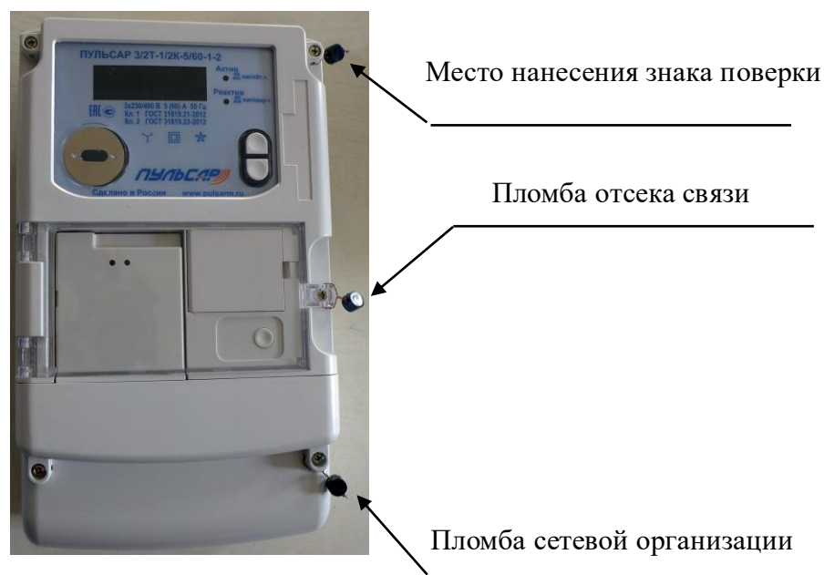
Рисунок 4 - Общий вид счётчиков с отсеком под модуль связи с указанием мест нанесения знака поверки, с указанием места пломбирования пломбой сетевой организации, а также с местом пломбирования отсека связи.